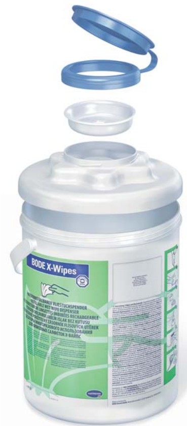
3-teiliges Deckelsystem sowie Spendergehäuse für einfache und sichere Aufbereitung